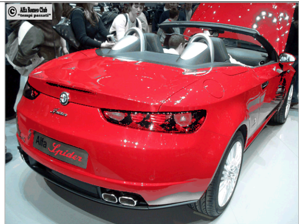
Der neue Spider am Autosalon, Bild von unserer Homepage

Liebe Clubkollegen und gelegentliche Gäste*