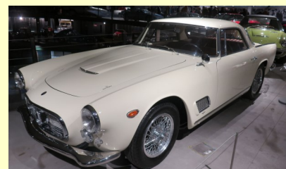
Maserati Coupé 3500 GT von 1961

Maserati 3500 GT Spyder Vignale 1960, oder auch. →